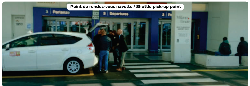
Point de rendez-vous navette / Shuttle pick-up point