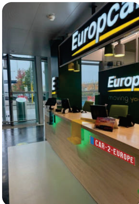
Point de rendez-vous navette / Shuttle pick-up point