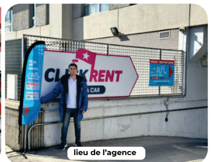
lieu de l'agence