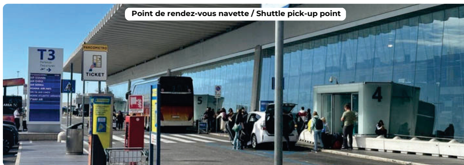
Point de rendez-vous navette / Shuttle pick-up point